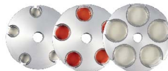
シャーレサイズに合わせたローター (Φ35、60、90mm など)