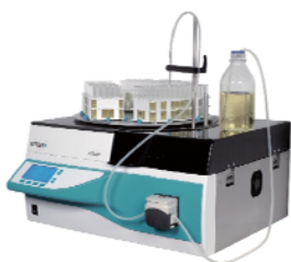
チューブフィラー（試験管分注）