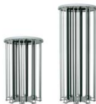
カラーセル(シャーレ540枚用)