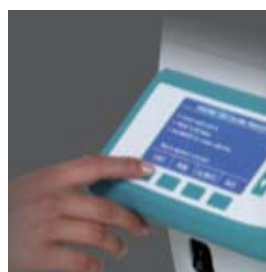
プログラムを選択し、スタートボタンを押す