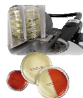
シャーレ印字システム