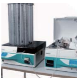
分注チューブを接続