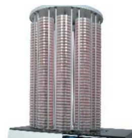
分注終了。 360枚を約20分で処理