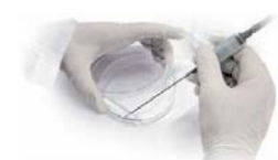
シャーレ分注 シャーレ洗浄コーティング

各パラメーターを調整し、アスピレーターや段階希釈を自動化するシリアルダイリューターとしても使用できます。