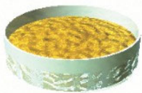
サンプルをセット