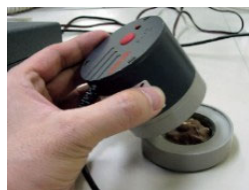
測定ステーションをセット 測定開始