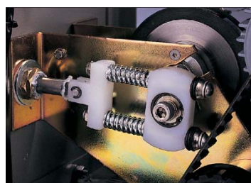
本体の内部構造図