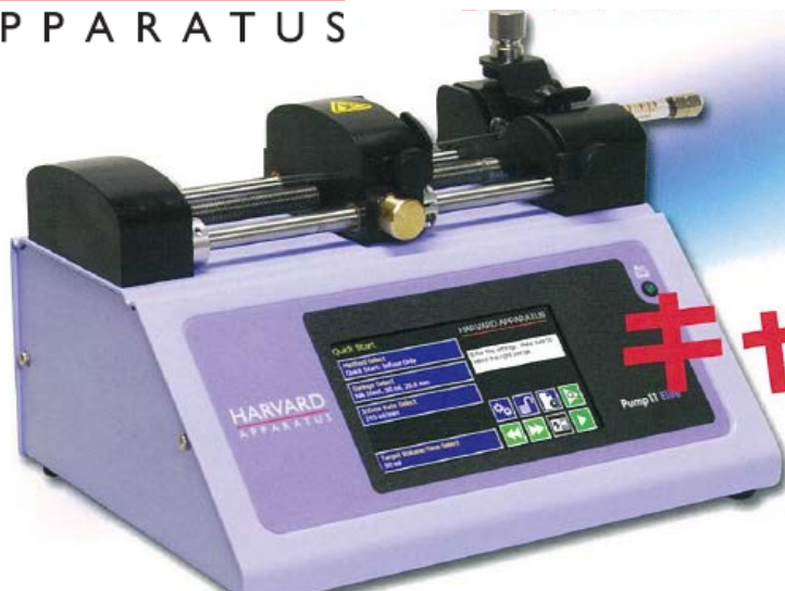
Syringe Pump Comparison